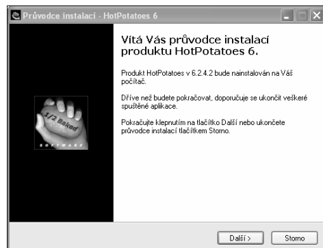
Obrázek 1: Instalace