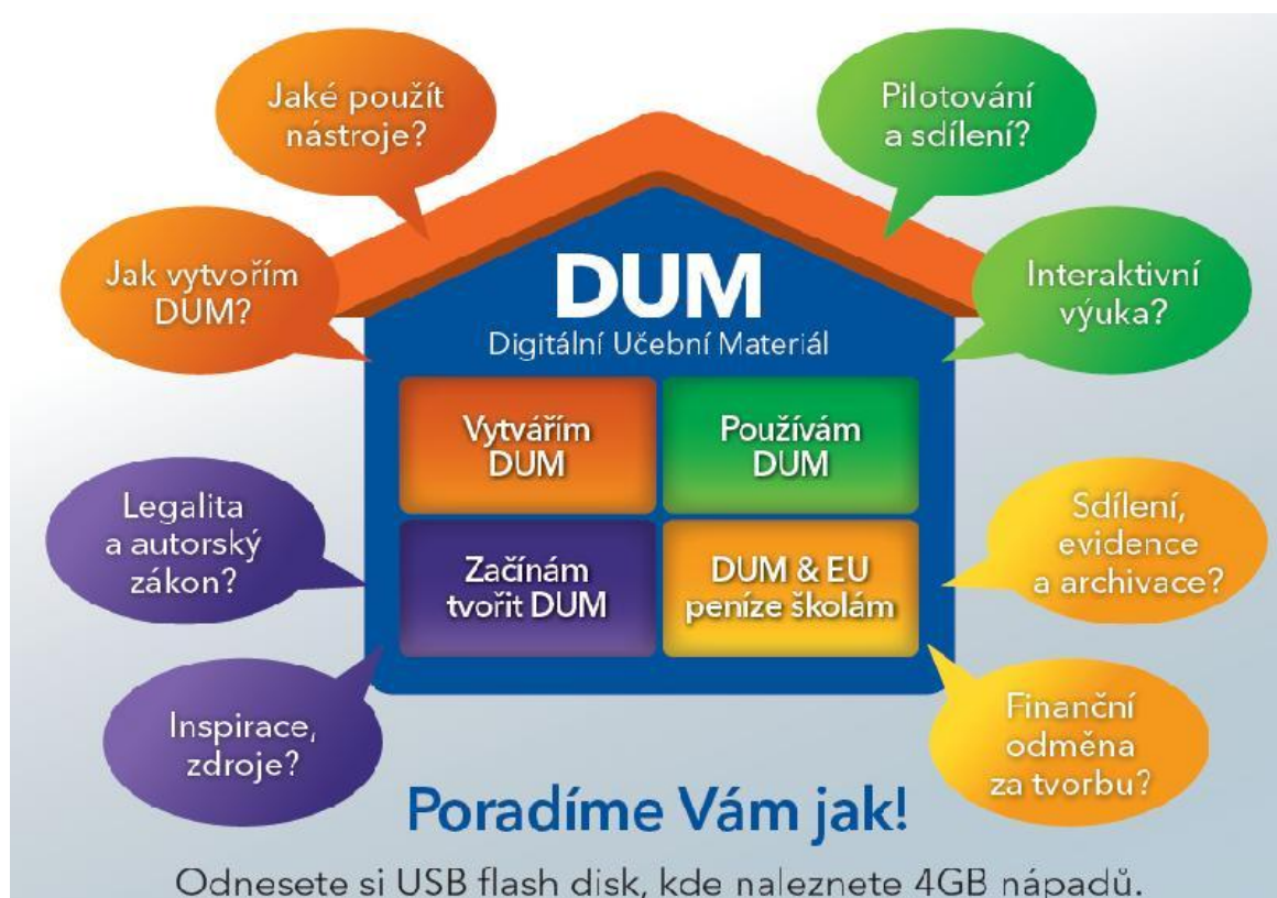
Obrázek 5 Ukázka z prezentace, kterou pro pedagogy připravilo Centrum vzdělanosti Libereckého kraje společně se svými partnery sdruženými ve společenství ITveskole.cz.

Myšlenkou zjednodušení dostupnosti výukových objektů pro pedagogy se zabývají víceméně všechny státy Evropské unie. To byl také důvod, proč organizace European Schoolnet zprovoznila on-line službu Learning Resource Exchange for Schools (LRE). Ta umožňuje školám vyhledávání vzdělávacího obsahu v mnoha různých zemích a od různých poskytovatelů vzdělávacího obsahu. Ve své dnešní verzi se jedná o propracovaný systém propojených serverů, na něž učitelé z jednotlivých členských států EU a několika dalších zemí mohou ukládat své elektronické soubory, které je možné využít při přípravě na vyučování nebo přímo při výuce. České úložiště DUM na RVP.CZ je s LRE propojeno, takže vyhledávat zahraniční DUMy mohou čeští učitelé přímo z prostředí DUM na Metodickém portálu RVP.CZ. Je však třeba upozornit, že koncept výukových objektů je v každé zemi trochu odlišný a tak i samotné objekty na LRE v naprosté většině nesplňují specifika českých DUMů. Bližší informace o LRE nabízí Dům zahraničních služeb .