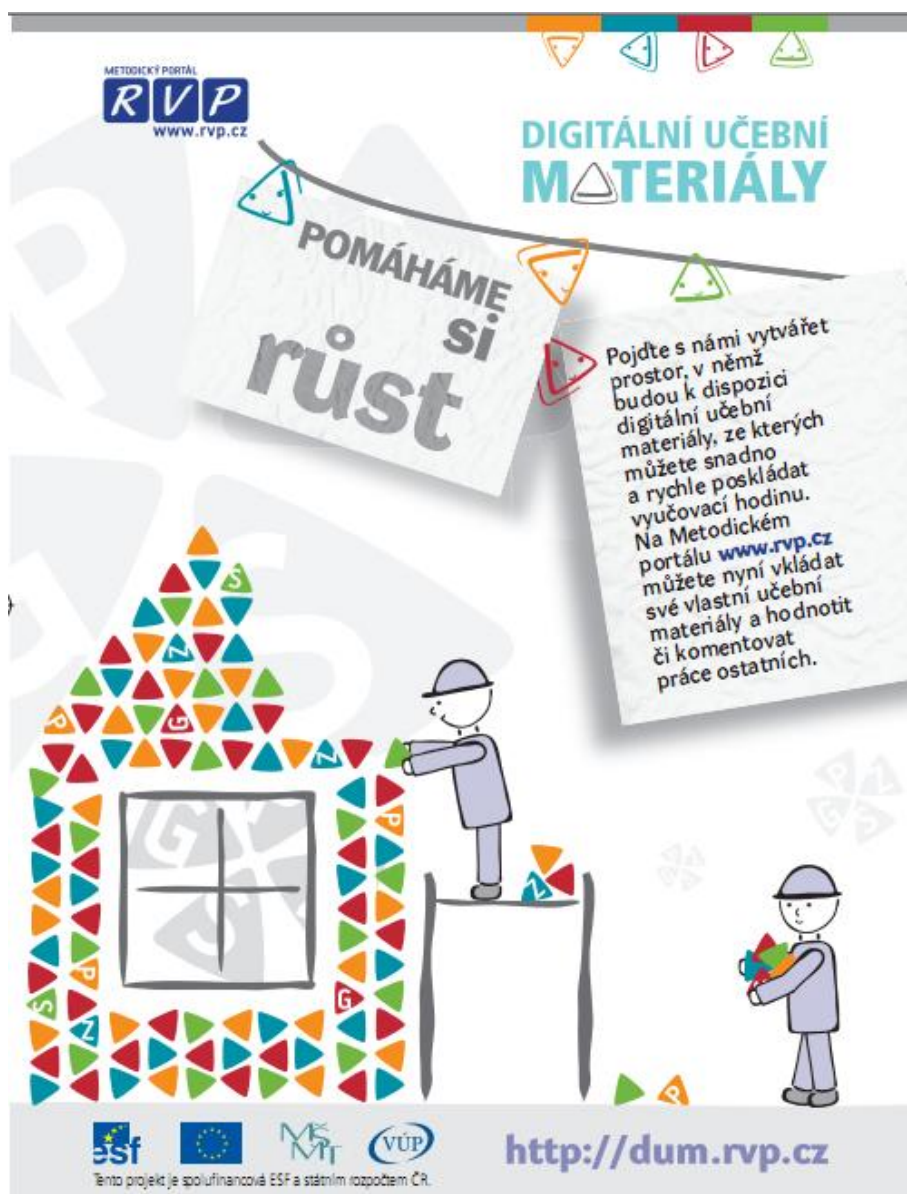
Obrázek 4 Letáček propagující DUM z roku 2008. Obrázek měl navozovat fakt, že DUMY připomínají kostičky stavebnice LEGO®, protože i ty jsou dílčí, lze je kombinovat a způsob jejich použití závisí na konkrétním uživateli. Stejně jako kostičky stavebnice LEGO® můžete vzdělávací objekty využívat bez podrobných metodických návodů, složitých úprav či speciálního vybavení.